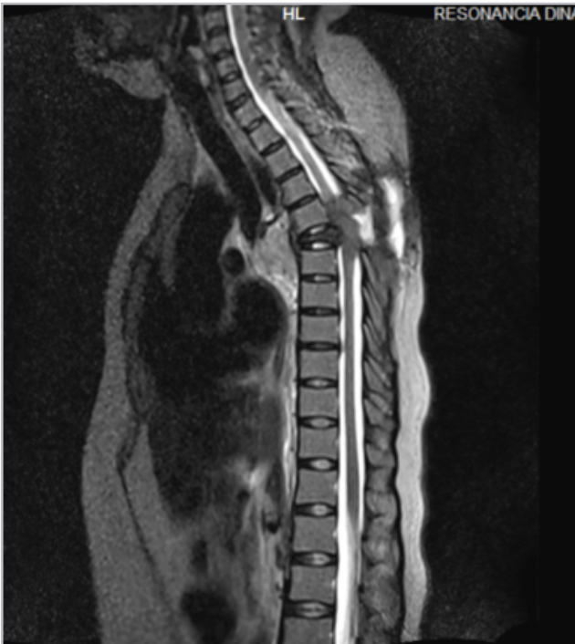
Figura 1. Resonancia magnética de columna dorsal en secuencia T2 corte sagital que muestra a nivel de T5 lesión ósea blástica que afecta cuerpo vertebral, pedículo y apófisis transversa.

DOI: https://doi.org/10.36104/amc.2023.2865