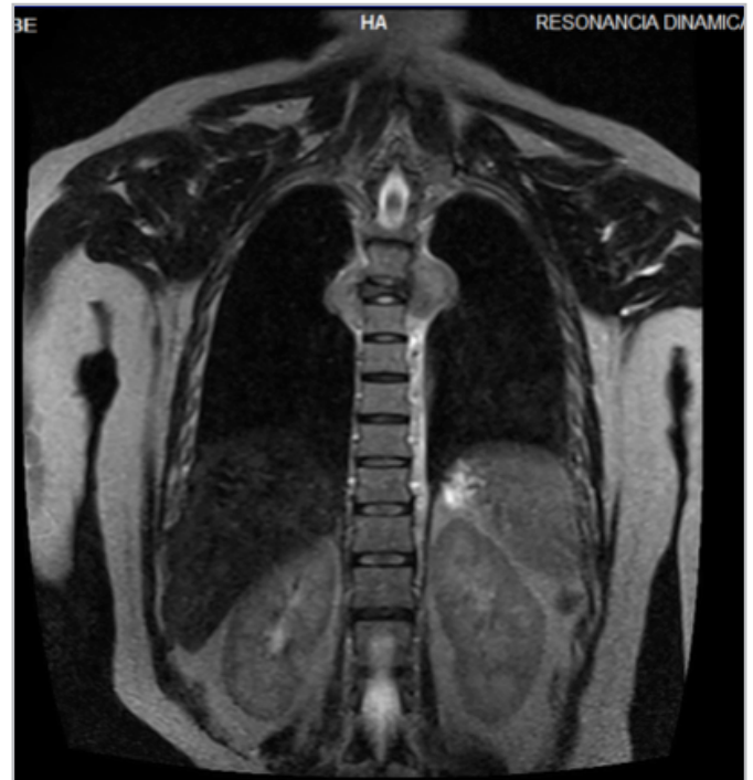
Figura 2. Resonancia magnética de columna dorsal en secuencia T2 corte coronal que muestra lesión ósea blástica en T5 que afecta cuerpo vertebral, pedículo, apófisis transversa y unión costo vertebral derecha condicionando disminución del diámetro intervertebral.