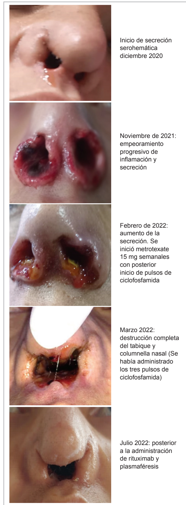
Figura 1. Seguimiento fotográfico de la evolución de las lesiones nasales.

Se definió inicio de rituximab 375 mg/m 2 semanal por cuatro semanas (500 mg semanales). Como reacciones a este medicamento presentó aumento de cifras tensionales, cistitis, cefalea, empeoramiento del dolor nasal, candidiasis vaginal y nasal, situaciones que cedieron con manejo médico y al finalizar las cuatro semanas se continuó tratamiento