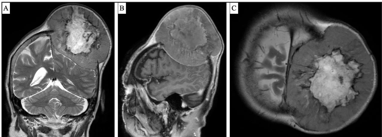
Figura 2. RNM de cerebro con gadolinio con gran lesión expansiva de 10.1 por 7.7 por 10.5 cm, con compromiso de región parietal izquierda a nivel extraaxial afectando tabla interna. A. Proyección coronal. B. Proyección sagital. C. Proyección transversal.

excepcionalmente raro en esta localización, con muy pocos casos descritos en la literatura (3).